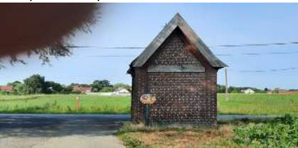
Manpadstraat op T rechts indraaien

vertragen, achterom kijken, richting aangeven