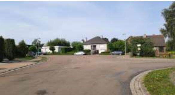
Rode Paard op T links indraaien Bredemolenstraat

vertragen en voorrang verlenen aan verkeer van rechts