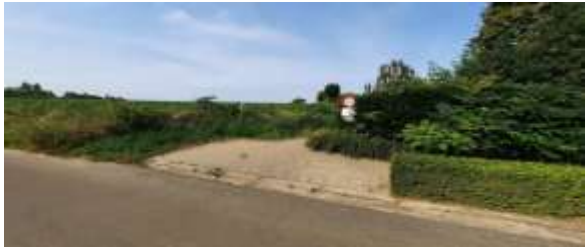
Bredemolenpad rechts inslaan en doorrijden tot Manpadstraat